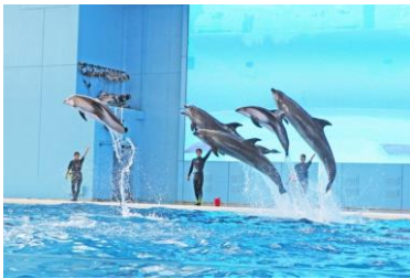
Animal Life Live!

生きものたちがお届けする“涼”と生きものたちがもつ本来の能力や魅力を体感していただけるパフォーマンスをお楽しみください。