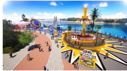
OTO-REACTION PARK (画像はイメージ)